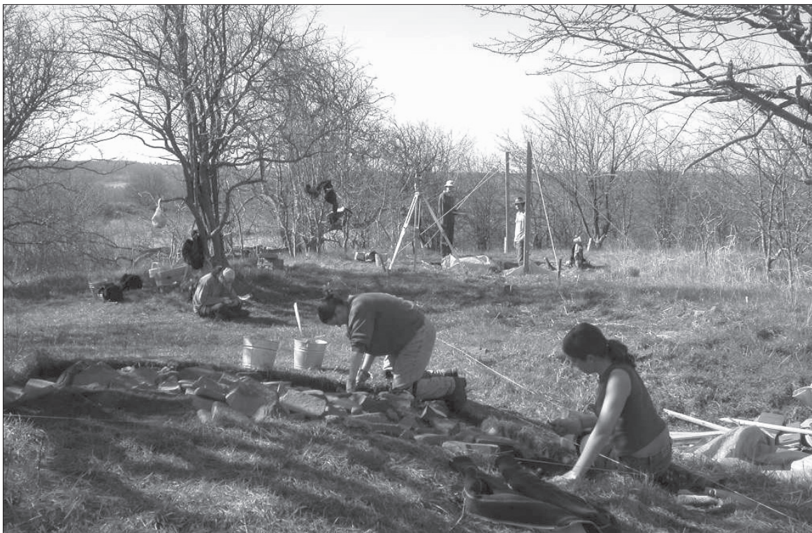
Chantier école de l'Université Sainte-Anne en 2005. Les étudiants dégagent les vestiges de deux grandes maisons acadiennes dont l'occupation remonte aux premières décennies du 18 e siècle.